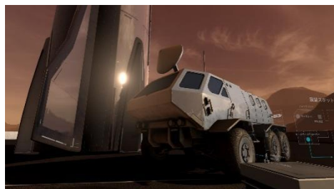
火星を駆け抜けるローバー