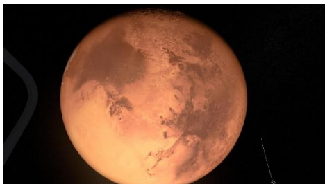
ロケットから見える火星