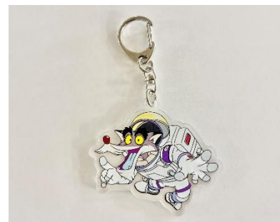
亚克力キーホルダー

※画像はイメージです。 ※表示金額は税込みです。 ※イベントの名称や内容および開催期間は変更になる場合がございます。