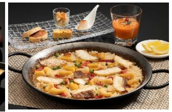
「真珠貝柱と伊勢まだいのパエリア」4,200円 (レストラン「アルハンブラ」) ※数量限定 ※画像は2名様から