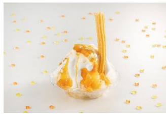
「たっぷりマンゴーのチュロス氷」