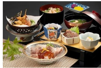
「パール御膳」4,000円 (レストラン「的矢」) ※数量限定