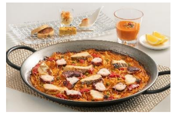
「シン・パエリア伊勢志摩～シマアジと真蛸のパスタパエリア～」 ※画像は2名盛り。ご注文は2名様から承ります。 ※8/1（土）から販売。