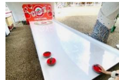
ミニゲーム「トマって～な」 1回500円（実施時間10:00～17:00）