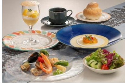
「サマーランチ」 3,300円 ※営業日はHPをご確認ください