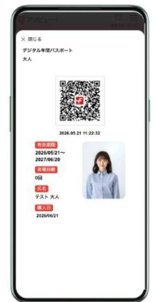
デジタル年間パスポート （イメージ）