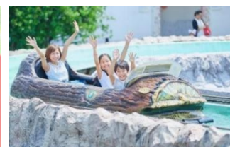
「スプラッシュモンセラー」