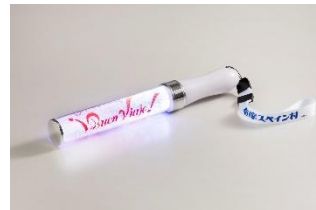
LEDペンライト「ペンピアへ」