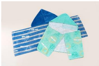
フード付きタオル