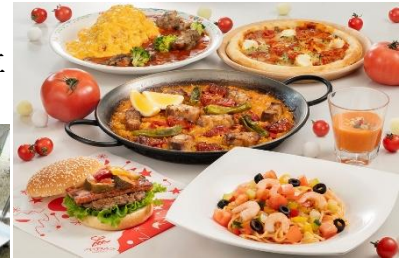
トマトメニュー各種