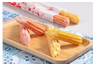
「冷んやりチュロス」