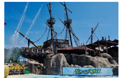
「ジャブジャブラグーン」